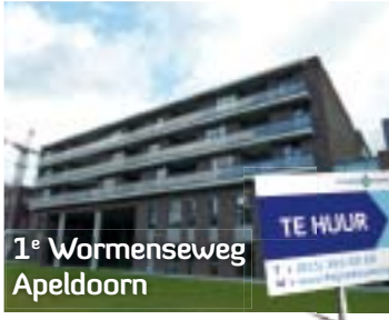
1 e Wormenseweg Apeldoorn